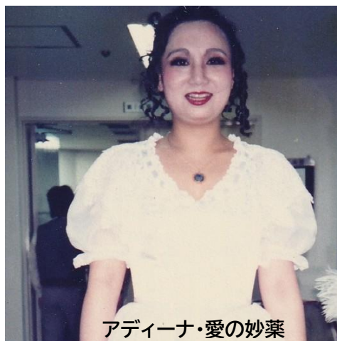
アディーナ・愛の妙薬