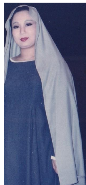
マタイ受難曲 Sop.Solo （二期会オペラ公演）