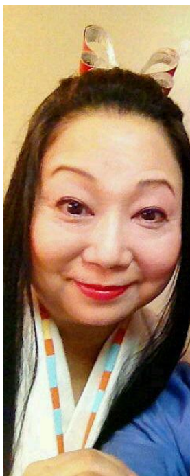
← Constantia (堅固/細川ガラシャ) Mulier fortis J.B.シュタウト作曲