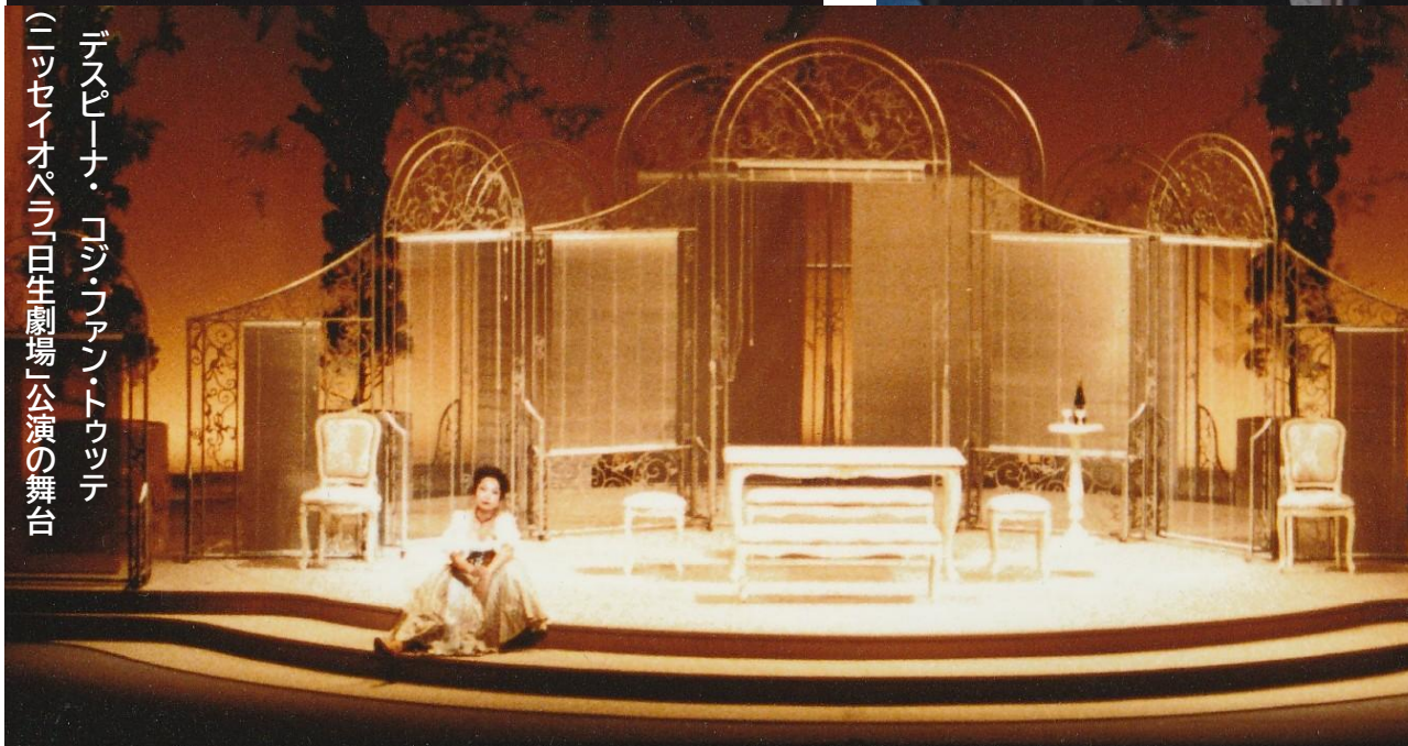
デスピーナ・コジファントウツテ (ニッセイオペラ「日生劇場」公演の舞台)