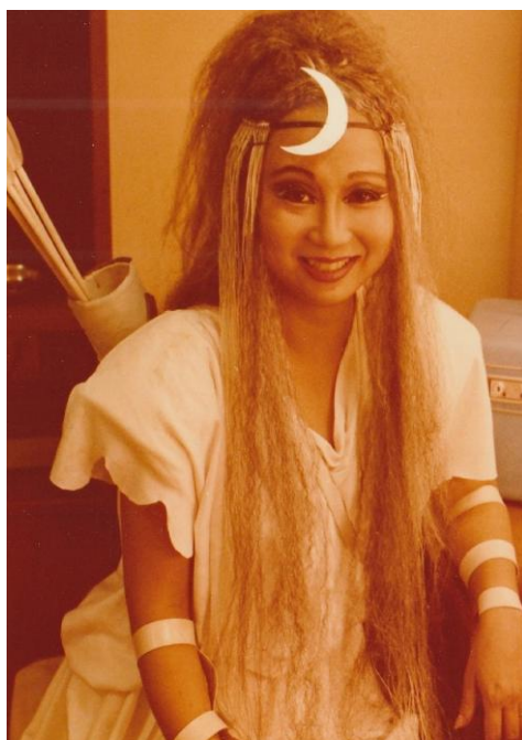
ダイアナ・天国と地獄