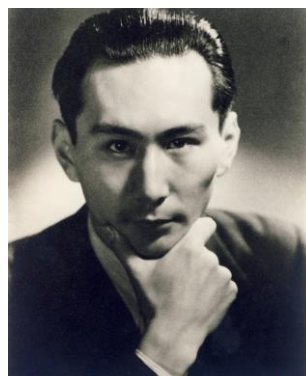
ベルリン・フィル公式 ポートレート